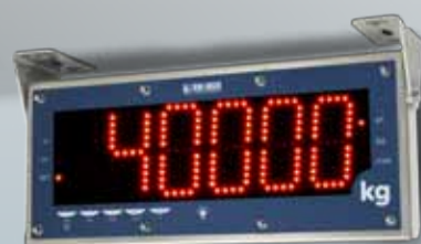
DGT 100 INSTALLAZIONE A SOFFITTO CON STAFFE ORIENTABILI