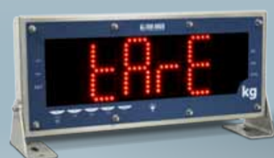
DGT 100 INSTALLAZIONE DA TAVOLO CON STAFFE ORIENTABILI