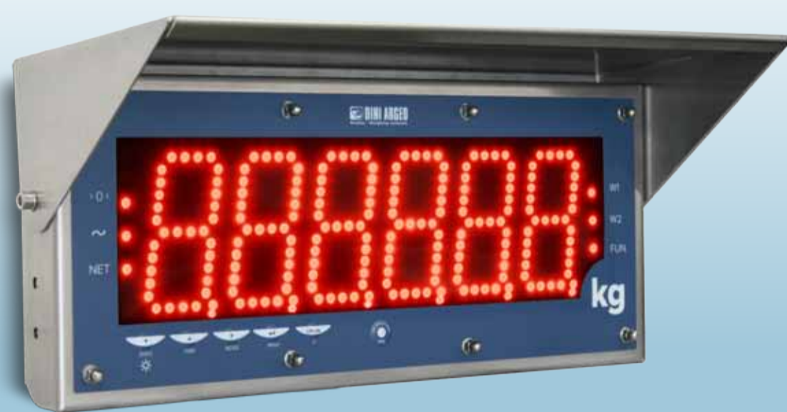
DGT 100 INSTALLAZIONE CON VISIERA